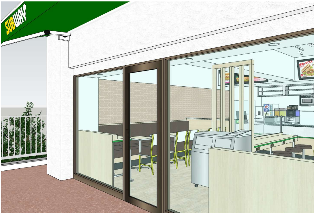
サブウェイ大森駅北口山王店 外観②